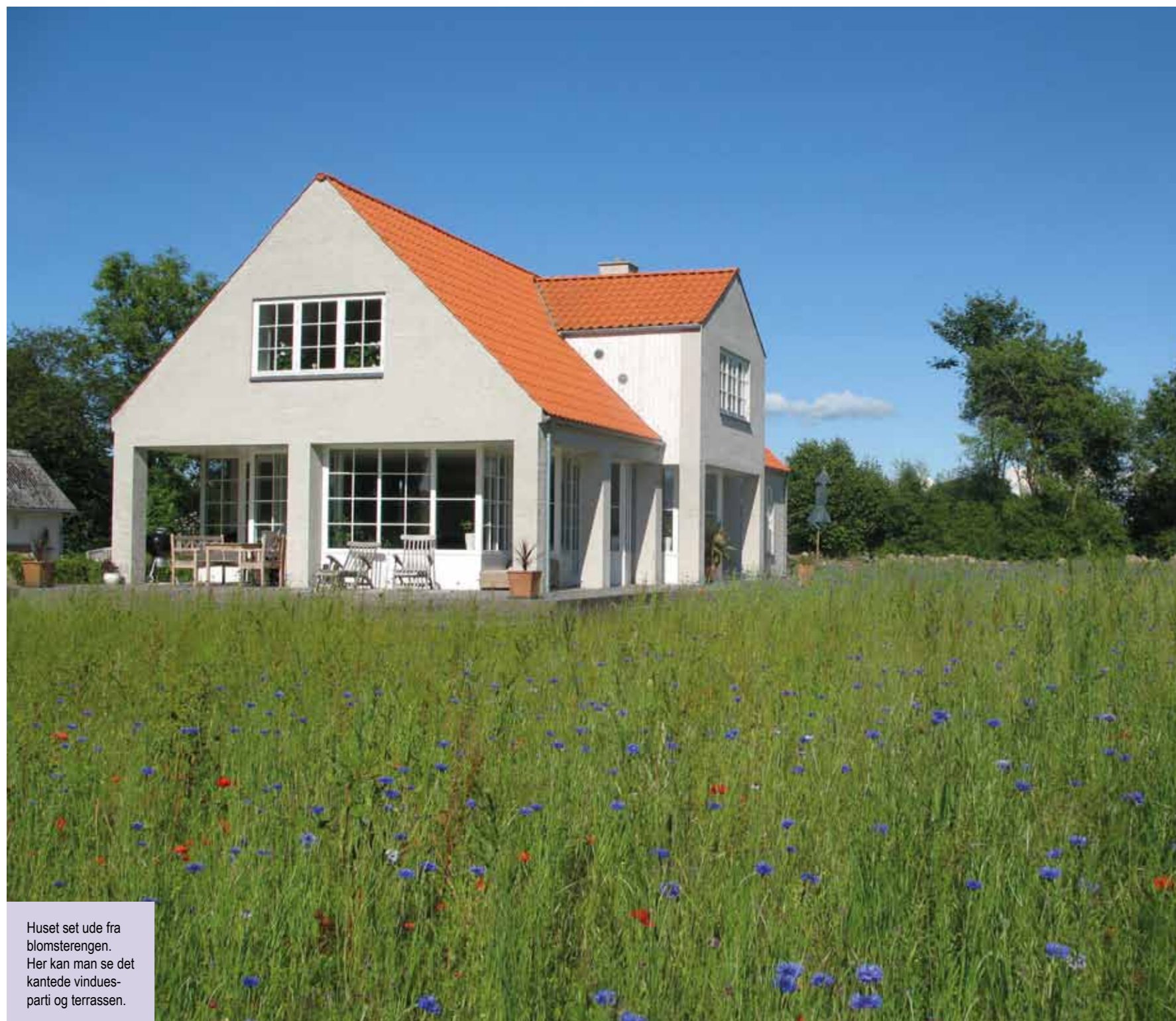
Huset set ude fra blomsterengen. Her kan man se det kantede vinduesparti og terrassen.

Stue, og køkken/alrum er ét stort rum omgivet af et sammenhængende vindue, som består af 8 ens vinklede partier. Det betyder, at man kan følge døgnets og årstidernes gang på tættest hold. Huset er tegnet af arkitekt Thue Zeuthen MAA.