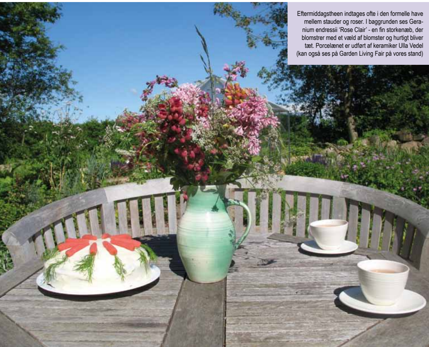
Eftermiddagstheen indtages ofte i den formelle have mellem stauder og roser. I baggrunden ses Geranium endressii 'Rose Clair' - en fin storkenæb, der blomstrer med et væld af blomster og hurtigt bliver tæt. Porcelænet er udført af keramikeren Ulla Vedel (kan også ses på Garden Living Fair på vores stand)