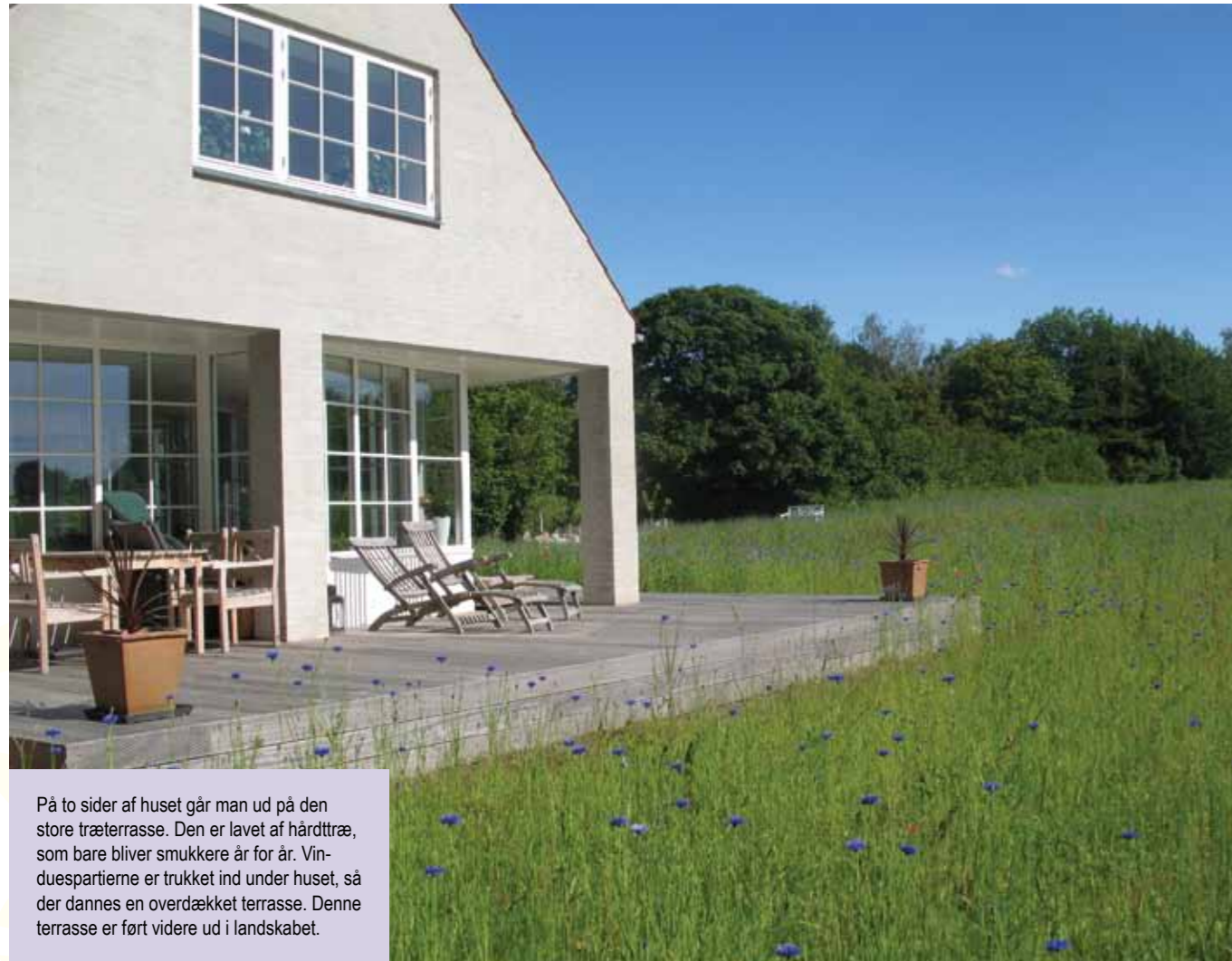
På to sider af huset går man ud på den store træterrasse. Den er lavet af hårdtræ, som bare bliver smukkere år for år. Vinduespartierne er trukket ind under huset, så der dannes en overdækket terrasse. Denne terrasse er ført videre ud i landskabet.

ste tulipaner, påskelliljer og den yndige Bispehue – for ikke at tale om de sene stauder - nydes på nært hold på trods af det lunefulde danske klima. I stedet for at hegne haven ind er der