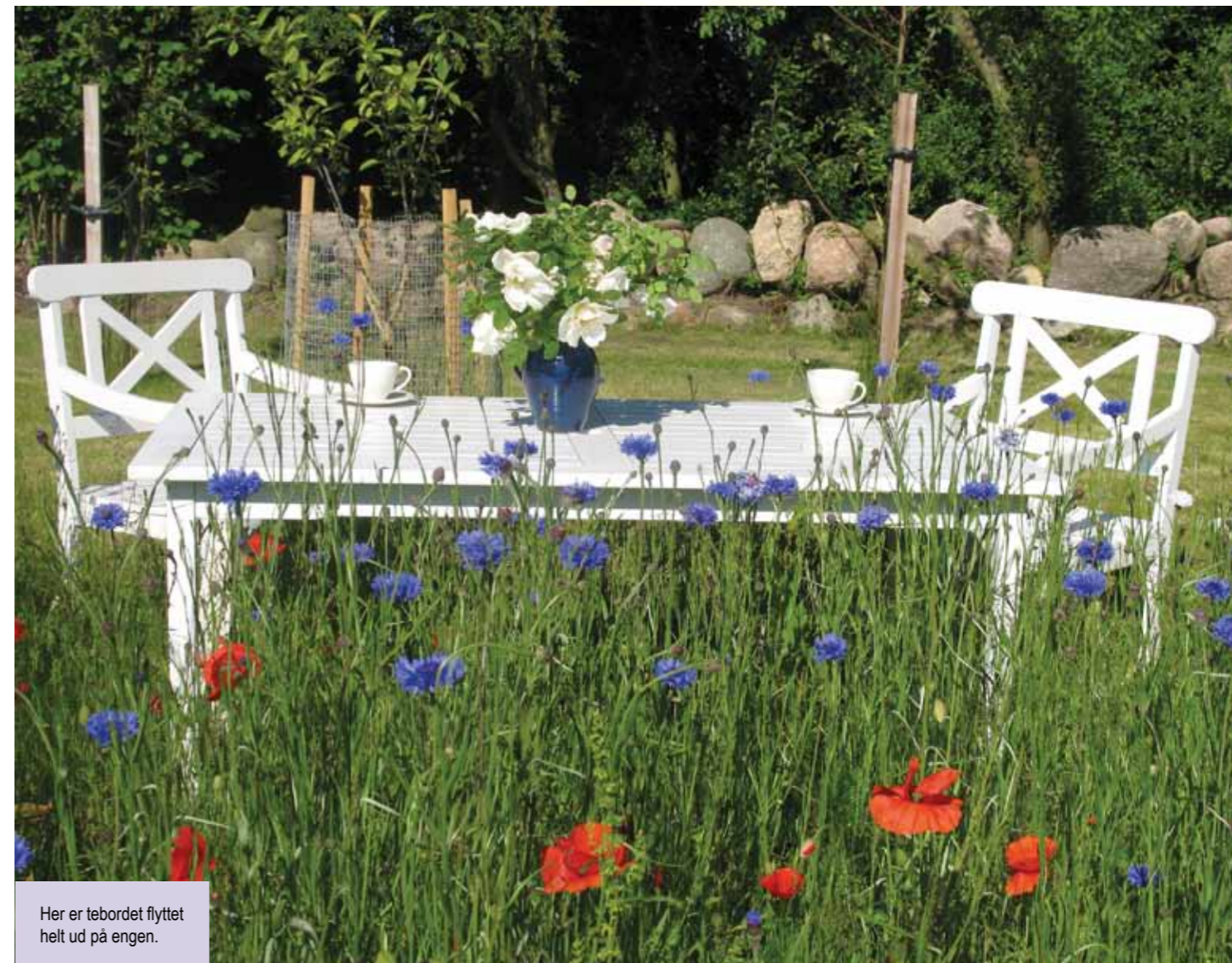
Her er tebordet flyttet helt ud på engen.