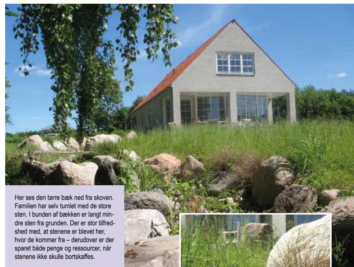
Her ses den tørre bæk ned fra skoven. Familien har selv tumlet med de store sten. I bunden af bækken er langt mindre sten fra grunden. Der er stor tilfredshed med, at stenene er blevet her, hvor de kommer fra – derudover er der sparet både penge og ressourcer, når stenene ikke skulle bortskaffes.

I gårdrummet er haven symmetrisk opbygget med små bede og grusbelagte stier. Buksbomhækkene anviser gangstien fra parkeringspladsen til hoveddøren. De skal være 140 cm høje. Hækkene adskiller også den symmetriske have ▶